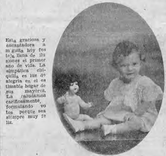
Esta graciosa y encantadora amiguita hoy festeja la llegada de su primer año de vida. La simpática chiquilla es luz de alegría en el estimable hogar de sus mayores. La saludamos cariñosamente, formulando votos porque sea siempre muy feliz.